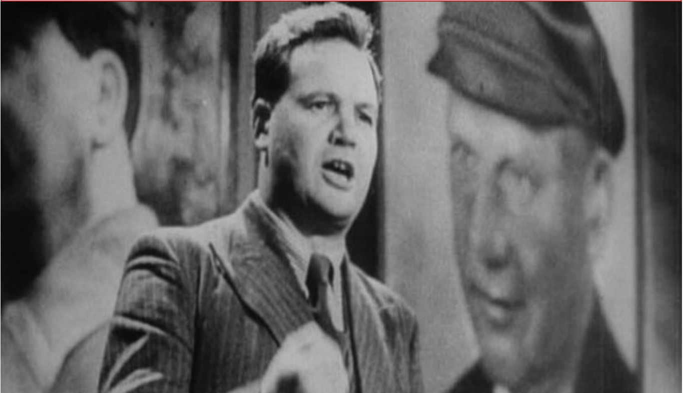
Photo © Maurice Thorez dans La vie est à nous , de Jean Renoir, 1936.